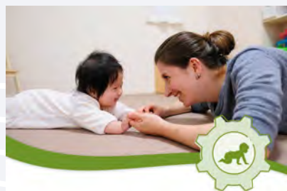
Formation Introduction Poupon CLASS®