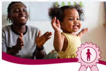
Formation à l'Observation Trottineur CLASS®