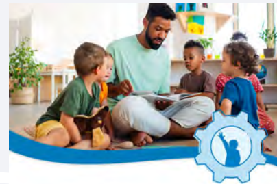
Formation Introduction Préscolaire CLASS®