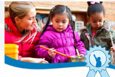
Formation à l'Observation Préscolaire CLASS®