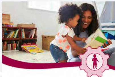
Formation Introduction Trottineur CLASS®